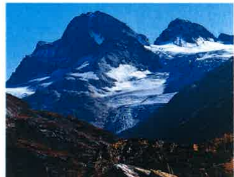
der Piz Buin im Silvrettagebirge

3 Stell dir vor, du möchtest eine Freundin oder einen Freund zu dir einladen. Sie oder er war noch nie bei dir. Beschreibe die Umgebung rund um deinen Heimatort in einem Brief. Wie sieht die Landschaft aus? Was kann man unternehmen oder besichtigen? Verwende Begriffe wie: